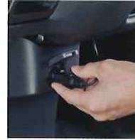
シガー電源に挿す