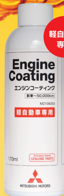
軽自動車専用 エンジンコーティング